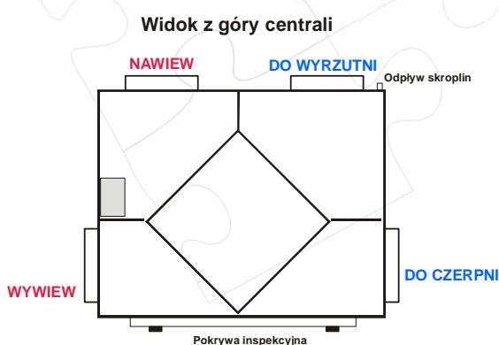
Wykonanie prawe (MISTRAL P) z wylotami od tyłu

Zgodnie z rysunkiem poniżej w nowych centralach króćce wylotowe (NAWIEW, DO WYRZUTNI) wykonane są na tylnej ścianie centrali.