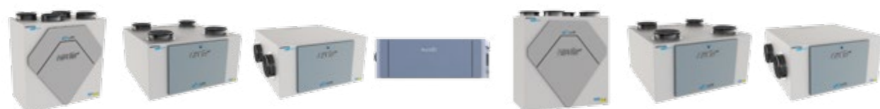
MISTRAL CITY 180 SV MISTRAL CITY 200 FV MISTRAL CITY 200 FH MISTRAL CITY 200 LH MISTRAL CITY 250 SV MISTRAL CITY 250 FV MISTRAL CITY 250 FH